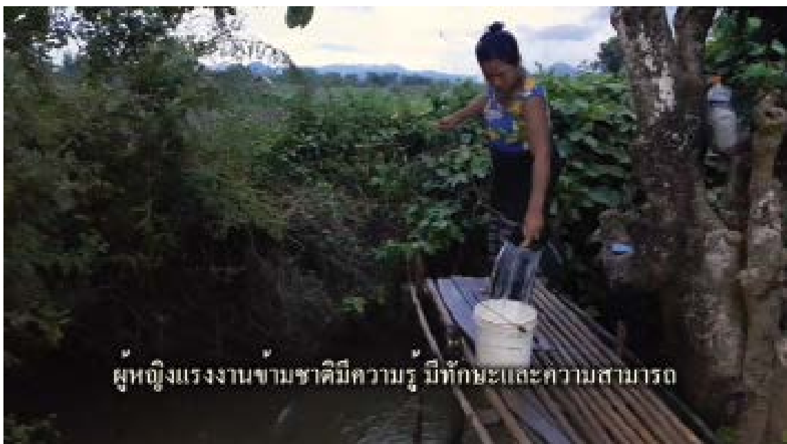
ผู้หญิงแรงงานข้ามชาติมีความรู้ มีทักษะและความสามารถ

แม้ว่าจะมีการตราพระราชกำหนดฯ ฉบับใหม่ ก็ยังไม่เห็นว่าการแก้ไขพระราชกำหนดฯ ฉบับแก้ไขเพิ่มเติม จะสามารถยกระดับชีวิตแรงงานข้ามชาติสตรีได้ ข้อกำหนดขั้นตอนการขึ้นทะเบียนยังคงเสี่ยงต่อคุกคามต่าง ๆ ต่อแรงงานข้ามชาติอีก เช่น ความเสี่ยงต่อการจับกุมและการส่งกลับประเทศ หากแรงงานข้ามชาติหลุดออกจากระบบ สิ่งที่แรงงานข้ามชาติหญิงต้องการโดยแท้จริง คือกฎหมายคุ้มครองแรงงานที่ครอบคลุม การบังคับใช้กฎหมายที่ดี และกระบวนการจัดการเอกสารที่ทั้งลูกจ้างและนายจ้างสามารถจัดการได้ด้วยตนเอง ปัญหาหนึ่งที่ยังไม่ได้รับการแก้ไขคือแรงงานข้ามชาติที่ไม่ได้มีบัตรประจำตัวประชาชนของประเทศเมียนมาร์ ซึ่งรวมถึงแรงงานข้ามชาติที่ไม่เคยได้รับบัตรประจำตัวชาวพม่า ผู้ทำเอกสารสูญหายเมื่อหนีออกจากการรุกรานทางทหารของพม่า หรือผู้ที่เกิดในประเทศไทย ขณะนี้ยังไม่มีความน่าไว้วางใจว่าจะทำอย่างไรกับกลุ่มนี้