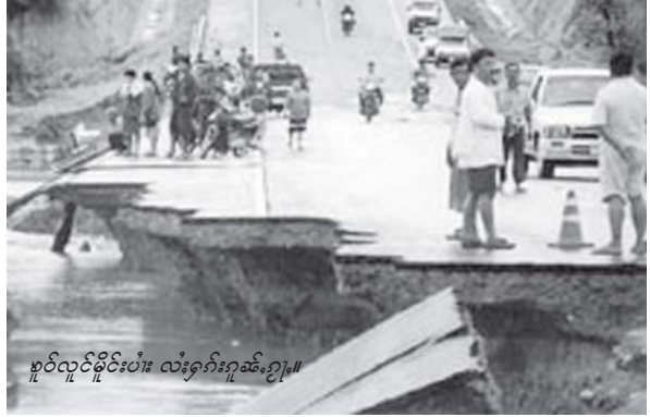
စွပ်လိုင်ရှိုင်းပံး လံးရှိုတ်းဂူဆဲးဂျ၊။