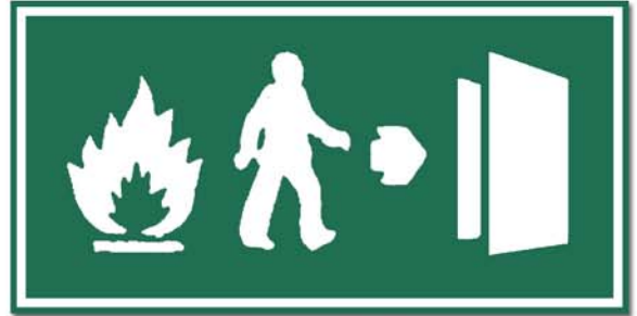
ပံးစွာ၊ ဗွားသံ့

သီခင်း၊ တင်း ကီခင်း၊ ပံး မိုင်း၊ ဗွားမိုင်း