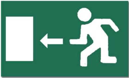
ကွက်၊ တင်းသံ့