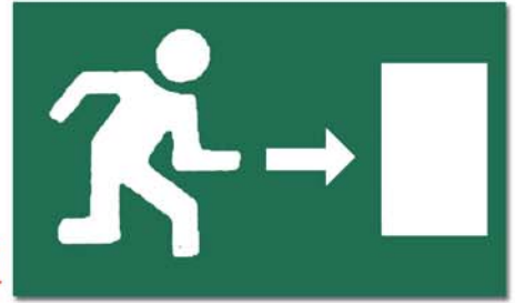
ကွက်၊ တင်းစွာ