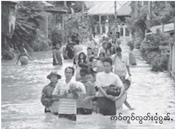
ကပ်တူလွတ်ပွဲခွာခွာ

လူမ်းလီင်ပူဆဲးဂျ၊ယဝ်ဂေး ဆမ်တေယွမ်းလူင်းဂျ၊ခိုဆဲး၊ မိုဆဲးဆင်၊ လူမ်းလီင်လူင် “လိဆဲးတျ၊” မိုဝ်းပီ 1997 ဆဲးဆဲး။