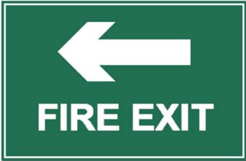
တင်းပံးဗွား