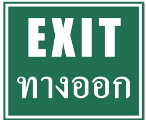
တင်းကွက်၊

သီခင်း၊ တင်း ကီခင်း၊ ပံး မိုင်း၊ ဗွားမိုင်း