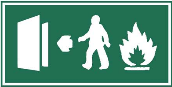
ပံးစွာ၊ ဗွားစွာ