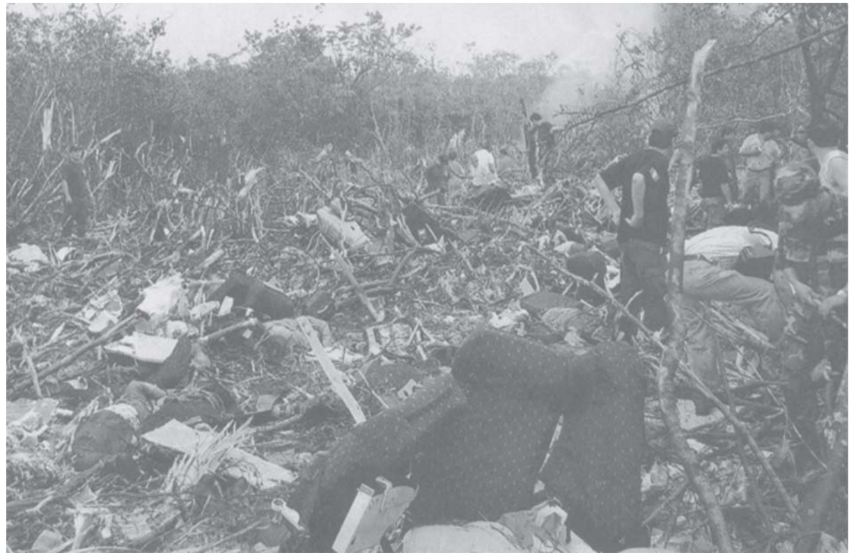
သွားရှိုင်း ရှိုင်းမိခင်တံးကဲ့သို့ ယွန်းပိုင်းဗဟိုပုဂ္ဂိုလ်ကိတ်း 737-200 မိုင်းပီခင်း လံးပုဂ္ဂိုလ်တို့ကဲ့သို့, ဆွေးထိုခင်း,လိုင်ကဆေး,လိုင်, Amazonian ဂံယာဆဲးတင်းဝင်း ပုဂ္ဂိုလ်ပုး 32 ကီးလိုင်မီး,တူဂါး, ဆွေးဝမ်းထိ 23/8/2005 ဆဆဲး။

မိုင်းဝမ်းထိ 23/8/05 ဆဆဲး ရှိုင်းမိခင် မိုင်းပီခင်း ကဆဲး ရှိုင်းဝုး ပုဂ္ဂိုလ်ကိတ်း 737-200 ပီခင်းဗဟိုပုဂ္ဂိုလ် တီးဆွေးဂေး လေး ဝင်း လိမုး တင်း ဝင်းဗဟိုပုဂ္ဂိုလ်ပုး။ ဆွေးရှိုင်းမိခင် မီးရှိုင်း ပဂါး,ပံ တိုက်လံးရှိုင်းတူဂါး 41 ဂေ့,ရှိုင်း။