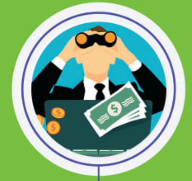
သိင်းငိုခင်းဂးယုတ်းယု။