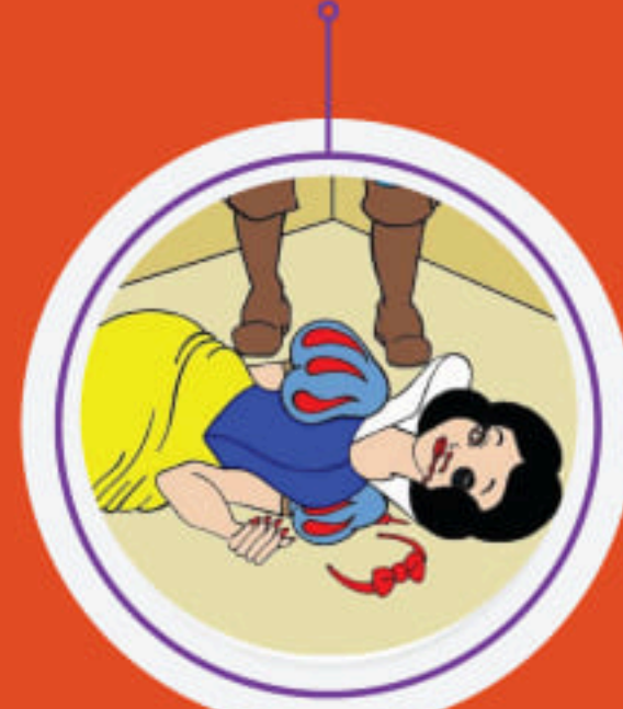
မာတ်,လိမ်း၊ ပိခင်တုဂ်ခိတ၊ လုသုမ်းသံလှို။