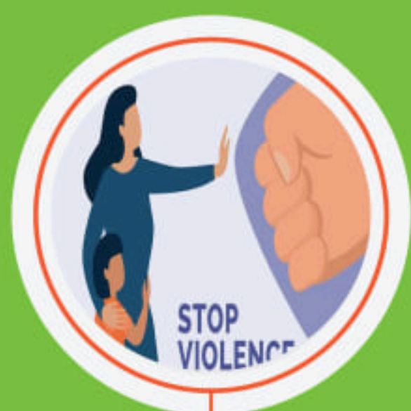
ဓာမ်,မီးလွင်းရှိုမ်း,လုမ်းဆွဲတိုင်,ပုင်းဂူခင်း။