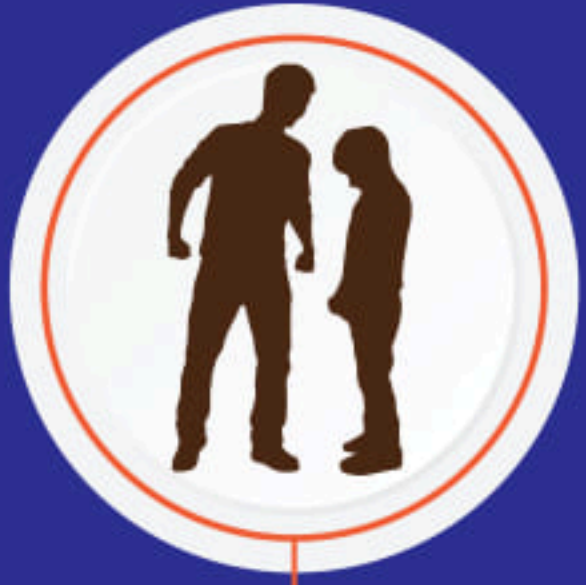
ပိခင်ဂူခင်းလိုင်လိုင်။