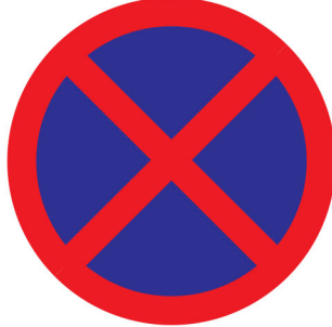
လူတံ့ကမ်,လံးလိုင်း