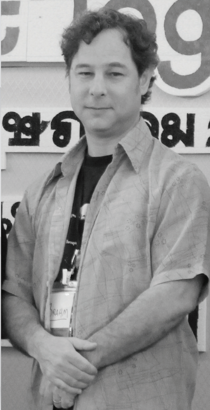
Brahm Press MAP foundation Director

လှိုတီးမူလဆီထို့မီပီပီ၊ သေယဉ် ယွမ်းတူင်တက်မို့၊ သုင်၊ ဗျား။ ဗျား ငှပ်ပိဆဲဗျားခွမ်း လုမ်းမီပီပီ၊ (ဗျားခမ်းဆူလင်းဂါဆဲ) ခလး လုံးရှပ်ရှိုတီး ဂါဆဲဆေးတီးပုဆဲဗျားဗျား ငှပ်ထိုင်ပီယဉ်ဗျား။ ဗျားယမ်းဆဲခွံ ဗျား၊ ငါးလွင်းယမ်းမိုင်းဆဲ ပီဆဲလွင်းလမ်းလွင်းပုံ။ တီးဆဲးမိုင်းယူးဂုပ်၊ ပွတ်း တွမ်းကျ၊ ဗေဂျ၊ ဂျေ၊ မီးဂူဆဲယမ်းမိုင်း ဂါဆဲရှပ်သိပ်မိုင်း၊ ကိုင်းစပ် မီးတိုင်းမိုင်းဗျား ဆင်၊ ရှိုဝဲဗေဝဲတေလီမိုင်းလုံးဆဲသေ သိုပ်၊ ဗျားတိုင်း ဗျားရှိုင်းပင်၊ လံ၊ ဂျေ။ ဂါဆဲခမ်တေ လွင်းဂါဆဲဗေဝဲ၊ ယမ်း ကွပ်၊ မိုင်း ဗျား လုံးထူးဗျားရှပ်လှိုင်သေ သုတ်းသိုင်းဂျေ၊ ဆဲးဂါဆဲခမ်းဆဲပင်၊ လံ၊ လှိုင် ခမ၊ တီးထရေဆဲးယမ်း Mediterranean Sea။ ဆဲးဂူဝိုင်းဂျေ Bay of Bengal ဂျေမိုင်းဂါဆဲ။ ဂူဆဲရှပ်ရှိုင်းမိုင်းဗျား တွမ်းတု၊ တေမီး ဗေဝဲခမ်းလီလှိုင်ခလး ဗျားရှိုင်းပံ၊ ဗေဝဲ၊ ယမ်း ဂူလုံးဂျေလုံးဂျေထူးထူး ဂူဆဲလှိုင်တီး မီးဆဲးတိုင်းတိုင်စပ် ဆမ်လှိုင်လွင်းလွင်းထိမ်ပမ်စပ်။ ဂူဆဲဂမ်ဆမ်တီးဗေဝဲ၊ ယမ်းရှိုင်းသေ များရှိုင်းဂါဆဲ ဆဲးမိုင်းထီးဂျေ မိုင်းဗျားတွမ်းတု၊ တေလုံးရှိုင်းဂါဆဲတီးလီ ဂူလုံးဂျေဂျေ ယင်းဂါဆဲ ပံ၊ လုံးရှပ် သုဆဲလုံးစပ်တိုမ်ထူး မိုင်းဆင်၊ လုံးရှပ်ဂျေရှိုင်းခက၊ လှိုင် သေဂျေရှိုင်းခမ်တိုမ်၊ တီးမံမီးတမ်းဝါးဝဲ ငျေ၊ ရှပ်လှိုင်ဆဲ။ ဗျားယမ်း ဂူဆဲရှပ်တေစံတီးစံတိုင်းသေခလးယမ်းမိုင်း မဆဲတိုင်းတေမီးဗေဝဲ မီးဆဲပုံယူယဉ်။ လှိုင်ရှိုင်းဂျေယဉ် သင်ဝု၊ ဂါဆဲရှပ်၊ ဗျားမှန်းတီးထူး၊ မိမ်း လွင်းလှိုင်မိုင်းတီးရှပ်တေဂျေခလး ဂါဆဲမီးတီး ဂပ်းသိုပ်၊ ဂပ်း သါဆဲပုံဆဲတေ ဗေဝဲခမ်းဆဲဂျေ လင်းတေလုံးမီးလှိုင်လှိုင်သေဂပ်။ ဆဲးလွင်းပီဆဲတေမဆဲ ပေးဝု၊ ဂါဆဲရှပ်၊ ဂါဆဲပွင်လှိုင် သုဆဲလုံးဆဲလှိုင် ပီး ဆွင်ရှိုင်းဂါဆဲယမ်းမိုင်းစပ်ဂျေ ဆိုင်းခမ်းတေလုံးယူ၊ ပုးတူးဗေဝဲခမ်း လွင်းမီးဆဲးတိုင်းတိုင်။