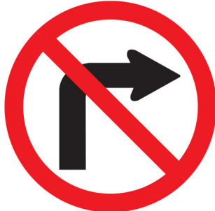
ကမ်,လံးငိးစု