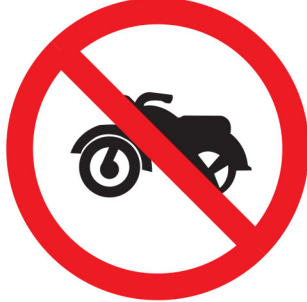
လူတံ့ခိုင်း ကမ်,လံးစပ်း