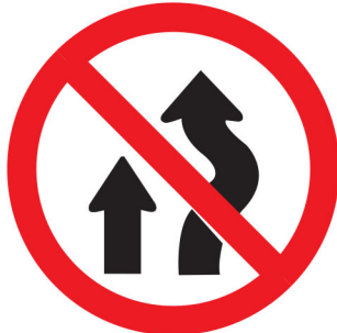
ကမ်,လံးစမ်းဂျ,