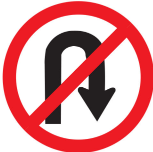
ကမ်,လံးငိး