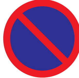
လူတံ့ကမ်,လံးဂိုတ်း