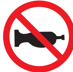
ကမ်,လံးပခ်သိုင်