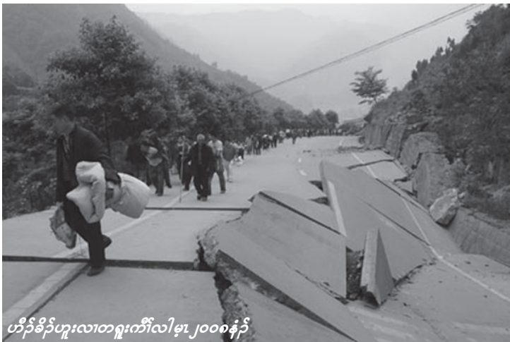
ဟိဉ်ခိဉ်ဟူးလအကွာကီလီမုာ် ၂၀၀၈နှဉ်

တစ်လလီဟိဉ်ခိဉ်ဟူးဝးအံးမုာ်တစ်တတော်တနီတမံလပုကညီအသးသမူ၊ ဟံဉ်ယိဒီးတစ်ထူးတစ်တဖန်အဂီလီ။ တအိဉ်ခိးတစ်ဆာကတီဘဉ်။ ဟူးဝးထီဉ်လအကစာ်ဒဲလီ။ ကဟူးဝးထီဉ်အခါဖဲလဲဉ်နှဉ်တစ်တဲအီတသ့ဘဉ်။ နိတစ်ဆာကတီလအကစာ်ဒဲဟ်လီဝဲအသိးနှဉ်ဟူးထီဉ်ဝးထီဉ်ဝဲဒဲလီ။