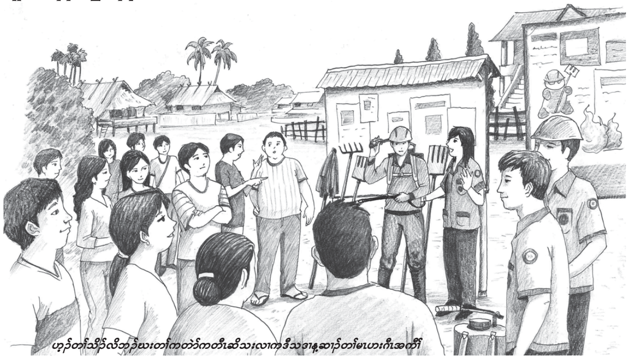
ဟုတ်တိုက်သိပ်လိဘန်ဗားတိုက်ကတံကတီဆိသးလၢကဒီသဒါန့ဆၢတိုက်မၤဟးဂီၤအဂီၢ်

(၁၂) မၤတၢ်ဆၢတံာ်တံာ်ခံၤမံၤလၢလၢတၢ်ပလီၢ်သး အပူၤတက့ၢ်. လူၤယုသ့ၣ်ညါမူခိၣ်ကလံၤသိၣ်ဂီၢ်တၢ်က စီၣ်တဖၣ်ဒ်သိးနဟံၣ်ဖိယိဖိကပူၤဒီးတၢ်လီၤပျံၤလီၤဖုး ဒီးအိၣ်ဘၣ်လၢတၢ်ဘံၣ်တၢ်ဘၢအပူၤအဂီၢ်လီၤ. လီၤတဲစီၣ်ဂီၢ်-၀၂-၉၃၈၉၈၃၀,၀၂-၃၉၉၄၀၁၂၂၄ (ကိၣ်တၢ်တၢ်ကီၢ်)