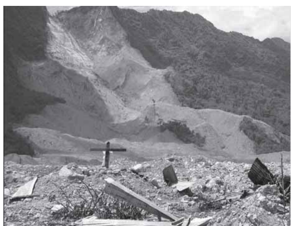
ဟီၣ်ခိၣ်လီၤလါလါကီၢ်ဖဲလံးပံး ၂၀၀၆န့ၣ်

(၁) အိၣ်ဆိးလါတၢ်သ့ၣ်ထီၣ်လါအကျါတဖၣ်အပူၤဖဲကလံတၢ်လီၤပျံၤလီၤဖုးကဲထီၣ်အဆာကတီၢ်.တ