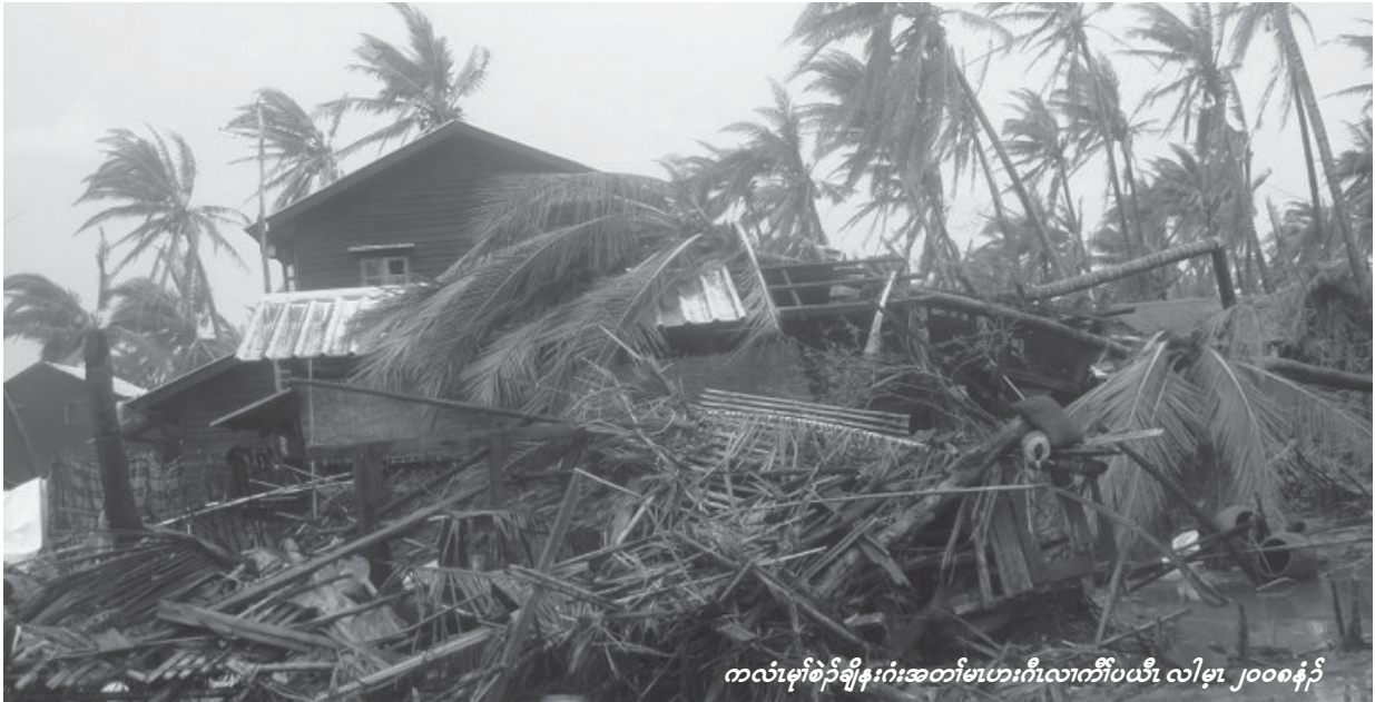
ကလံမုတ်စဉ်ချိန်းဂုံးအတော်မဟေးဂီလောက်ပယီ လါမု၊ ၂၀၀၈နှစ်

(၈) ထိခိုက်စွန့်ပျက်စီးပျက်စီးမှုများကို တုံ့ပြန်လျက်ရှိပြီး အရေးယူပေးရန်အတွက် အစိုးရအဖွဲ့မှ အရေးယူပေးရန် တောင်းဆိုထားပါသည်။