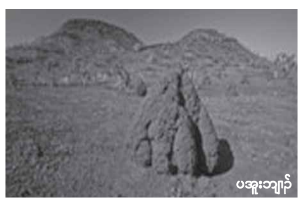
ပအူးဘျါၣ်