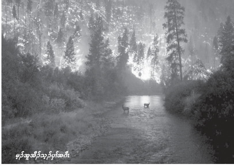
မ့ၢ်အုအိၣ်သုၣ်ပုၤအဂီၢ်.