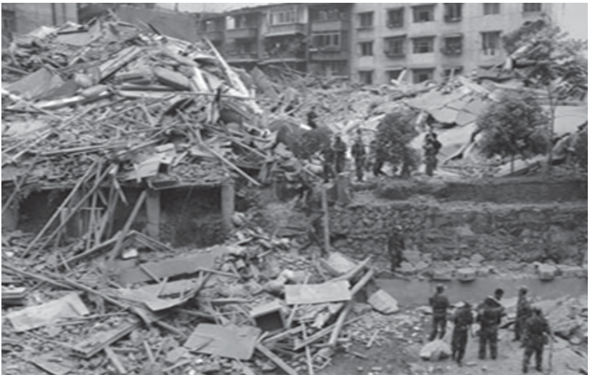
ဟိန်ခိန်ဟူးအတၢ်မၤဟးဂီၤလၢတရူးကီၢ် (လၢမၤ ၂၀၀၈န့ၣ်)

၆. တဘၣ်အိၣ်ဆိဖဲဘၣ်ဘိး(Billboard)လၢအတကျဲၤ ဘၣ်တဖၣ်အဖိလၢတဂ့ၤ.