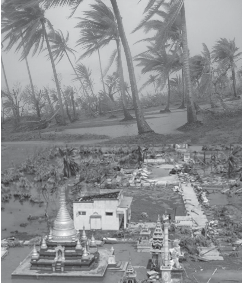
နးကံးစံကလံၤမုာ်ဖးဒိဉ်အတာ်မာယာ်ဂီၤလၢကီၢ်ပယီၤ. လၢမာၤ၂၀၀၈န့ဉ်