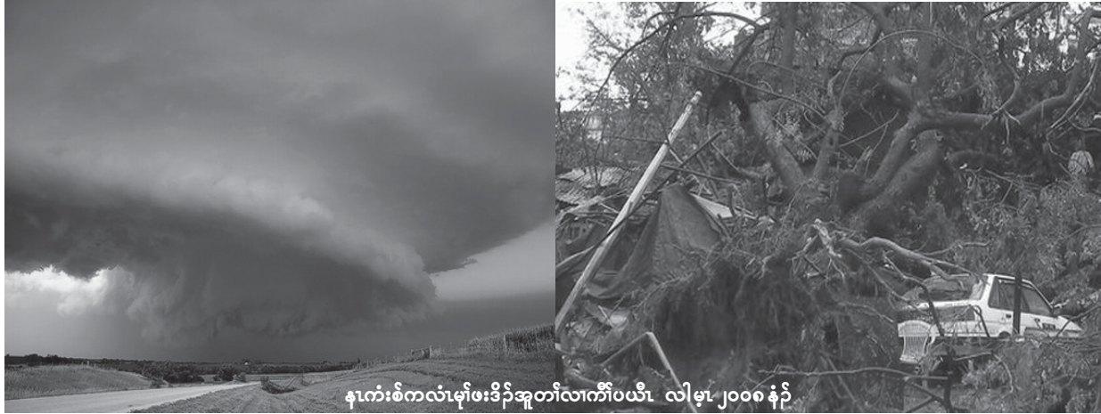
နကံးစဲကလံမုဖုဒ်အုတံလအကီပယီ လါမု ၂၀၀၈ နံ

နကုးစဲကလံမုလအအုသဘျးလီပိတံဒီး ဘီကလုနဲ့ဖဲအတုဆုကွဲးလး, တုဒ်တုဒီးဝှာတကူ အကပ အခါအသဟီလီစာလီဝဲတနုရံ နဲ့ အမံလး (၉၀) ဘျဲတု (၁၁၀) နဲ့လီ။ ကလံလအ အုဘာဝှာတကူအံ့အသဟီနုဝှာတကူအပူ