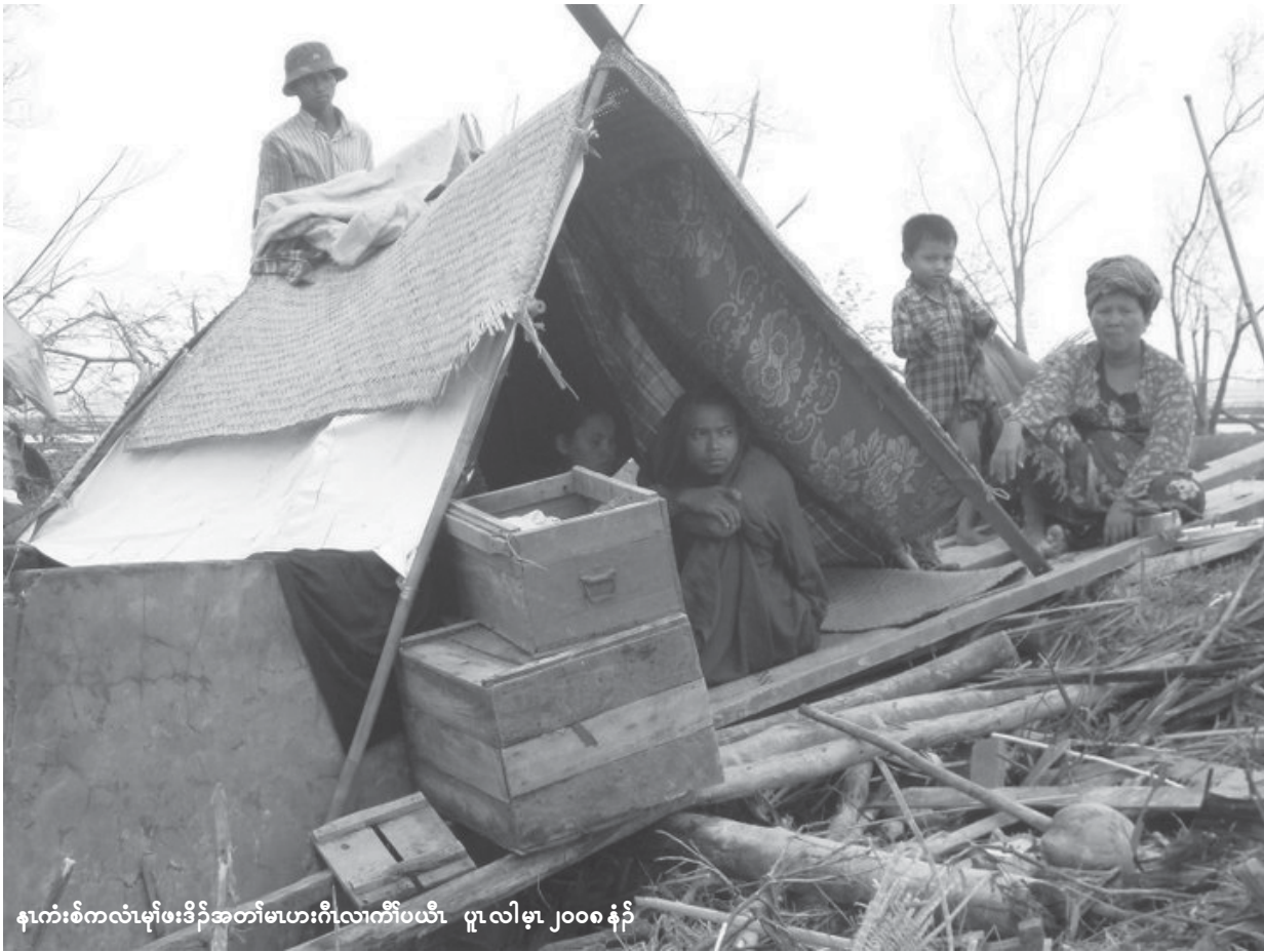
နက်စံကလေးဖမ်းခိုအတားမဟားဂီလောက်ပယီ၊ ပုလဲလီမု၊ ၂၀၀၈ ခုနှစ်

ဘဉ်တော်လီမနုသုတ်တဖှ်လဲဉ်န့ဉ်ဘီမုထံကီမုခိဉ်ကလံသီဉ်ဂီဝဲခိဉ်ခိဉ်တယာ်ဆိဝဲဝဲထုးထီဉ်ရုလီတော်ကစီဉ်န့ဉ်လီ။ ဘဉ်ဆဉ်သနာ်က့, ပထံကီတခီလတော်ဘုဉ်တော်တီတဂုဘဉ်အယိတော်ကစီဉ်လတော်ထုးထီဉ်ရုလီတယာ်ဟ်ဆိဝဲလတော်ဟ့ဉ်ပလီအဂီဉ်ဒီးကလံမုဖဲအနီကီအဆာကတီန့ဉ်တလလီအသးဖးခိဉ်ညါန့ဉ်လီ။ လတော်န့ဉ်အယိပုသံဟါမာ်ဒီးပထံကီအမုသပါဖးခိဉ်ဘဉ်တော်တီသုတ်ဖးဟားဂီကွံဉ်အယိဖဲယဆိကမိဉ်ဟ်ထံနီဖး, ယုတော်အစာလတော်အံမုမတေအတော်ကမဉ်