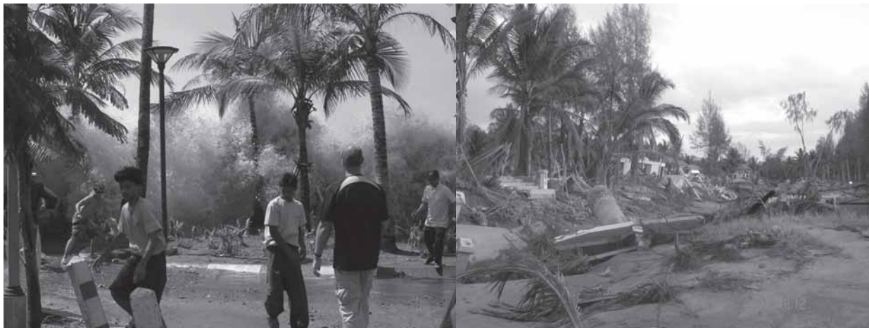
စုန်နစ်မံင်ကဲထိုင်လဟာတိုင်းကွာတတ် ကလံထံးဟ်ကတီ ၂၀၀၄နီင်