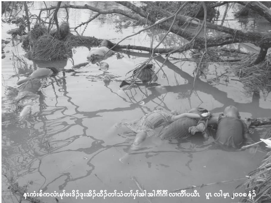
နၢကံးစံကလံမုၢ်ဖးခိၣ်ဒုးအိၣ်ထီၣ်တၢ်သံတၢ်ပုၤအါအါဂီၢ်လၢကီၢ်ပယီၤ ပုၤလၢမုၢ် ၂၀၀၈ နံၣ်

တကလၢအမၤမူခိၣ်ကလံၤ သီၣ်ဂီၤမူဒါခိၣ်န့ၣ်ဟံးန့ၣ်ဝဲပုၤ မၤထံၣ်ရၢၢ်ကီၢ်သးလၢအဝဲတ ဘၣ်သ့ၣ်ဘၣ်သးသ့ၣ်တဖၣ် အမံၤဝံၤစးထီၣ်ယုၢ်န့ၣ်ဝဲက လံၤမုၢ်သ့ၣ်တဖၣ်အမံၤလၢပုၤ သ့ၣ်တဖၣ်န့ၣ်အမံၤစုၣ်စုၣ်အ ဂ့ၢ်န့ၣ်ကီၢ်အမဲရကၤဒီကလုၣ် ဟဲရဲခွဲၤလီၢ်ခိၣ်သ့ၣ် (U.S National Hurricane Center)စံးဝဲဒၣ်န့ၣ်လီၤ. အဲး တလၢတုးပီၣ်လဲၣ်မိၢ်ပုၤအ ကလံၤစီးတကပၤအပူၤ စဲၣ် ကလိကလံၤမုၢ်သ့ၣ်တဖၣ်အ မံၤတခီဖဲ ၁၉၅၃ နံၣ်န့ၣ်အမဲရကၤမူခိၣ်ကလံၤသီၣ်ဂီၤဝဲၤ ကျိၤစးထီၣ်ယုၢ်န့ၣ်ကလံၤမုၢ်သ့ၣ်တဖၣ်အံၤအမံၤလၢပုၤပိၣ် မုၢ်သ့ၣ်တဖၣ်အမံၤန့ၣ်လီၤ. ဖဲ ၁၉၇၉ နံၣ်တုၤယီၤအဆၢ ကတီၢ်မးယုၢ်န့ၣ်ယုၢ်က့ၤကလံၤမုၢ်သ့ၣ်တဖၣ်အမံၤလၢပုၤ ပိၣ်ခါသ့ၣ်တဖၣ်အမံၤန့ၣ်လီၤ. တၢ်ယုၢ်န့ၣ်ကလံၤမုၢ်သ့ၣ် တဖၣ်အံၤအမံၤအတၢ်ပညိၣ်န့ၣ်မုၢ်ဒ်သိးပုၤအါဂၤကဟ် သ့ၣ်ဟ်သးဒီးပဒုၣ်ဟးဆွဲးအသးလၢတၢ်လီၤဘၣ်ယိၣ်အ လီၢ်ဘၣ်ဆၢဘၣ်ကတီၢ်ကသ့အဂီၢ်န့ၣ်လီၤ.