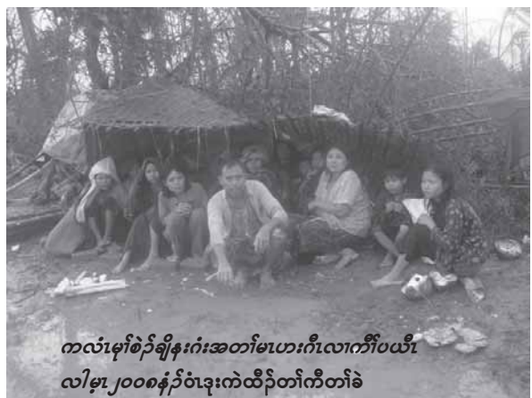
ကလံမုတ်စဉ်ချိန်းဂုံးအတော်မဟေးဂီလောက်ပယီ လါမု၊ ၂၀၀၈နှစ် ဝံဒုးကဲထိုက်ကီတံခဲ

(၁) လာဘ်ကီလီကတီနှင့် ကလံမုတ်စဉ်ချိန်းဂုံးအတော်မဟေးဂီလောက်ပယီ လါမုနှင့် အခြားအရေးယူပေးရန်အတွက် အစိုးရအဖွဲ့မှ အရေးယူပေးရန် တောင်းဆိုထားပါသည်။