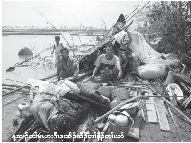
န့ၣ်တၢ်မၤပာ်ဂီၤဒုးအိၣ်ထီၣ်တၢ်ဖိၣ်တၢ်ယာ်