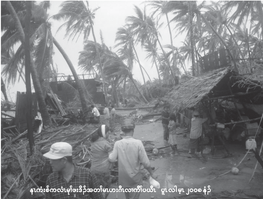
နာကုံးစံကလံမုဒ်အတိအတိမဟားဂီလကီပယီ ပူလါမု ၂၀၀၈ နံ

ထူးထိုက် ဟ် ဖျါ ဝဲ လာ ကိုက် တူး ဟိုက်ခိုင်ဂီအပူနုအိုင်ဝဲဝဲသ တပတီဒီးလွှာတပတီအဘာ် စာ နှပ် လီ၊ ဝဲ လါ မှာ ၅ သီ ၂၀၀၈ နံ ကိုက် တူး ဟိုက် ခိုင် ဂီလယူနီဆဲးထူးထိုက်ဟ်ဖျါဝဲ ဘာ်ဃးထံဒိုင်အတိအိုင်သးဝဲ ထံထိုင်စွကီဒီလကလံမုဒ်အူ ဝဲနုထံဒိုင်ဝဲစးထိုင်ဝဲတိုင်တု တုဒုရဲ၊ ဖှပ်ပိုင်ဟိုက်ကဝီဒီတ ကျိ နှပ် လီ၊ ဒ် နှပ် အသိးပမု ကွာ်ဝဲတကူအိုင်အယာ လာ မုဒ်တကပ တိုင်တု၊ အူစုင်၊