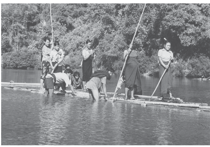
မိၢ်ဒၢတဖၣ်ဒၣ်လဲၣ် တူၢ်ဘၣ်တၢ်မၤဆူၣ်မၤတၢ်န့ၣ်လီၤ

• “ပဂ့ၢ်လိၣ်လၢပတလဲၤမၤတၢ်တသ့ဘၣ်. ပတအိၣ်ဒီးတၢ်ခွဲးတၢ်ယၢ်လၢပကဂ့ၢ်လိၣ် တၢ်ဖိးတၢ်မၤအဂ့ၢ်ဘၣ်. တဘၣ်ဝဲလၢနက အုကစၢ်ဒီးလဲၤဆိုးထီၣ်တၢ် ဂ့ၢ်န့ၣ်တဂ့ၢ်. ထဲ နမ့ၢ်တလဲၤမၤတၢ်မးန့ၣ်ပှၤသးဖိတဖၣ်ဟဲ မၤ သံန့ၣ်သးဒီး