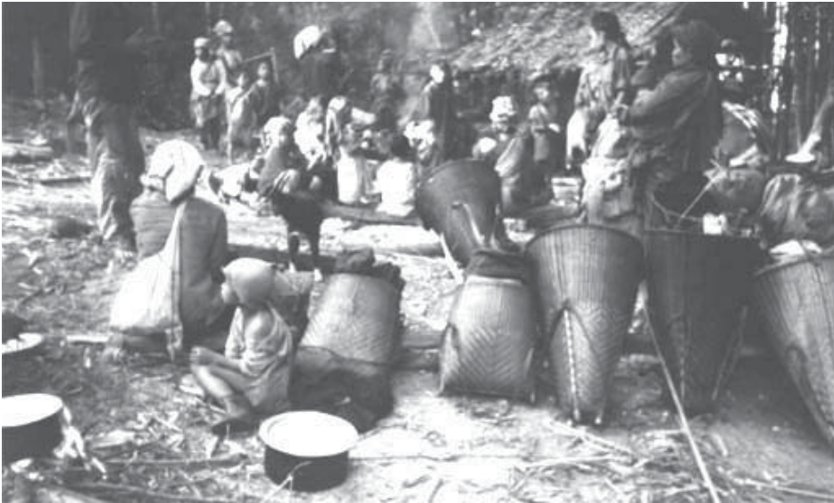
သဝီဖိတဖၣ်ဘၣ်ယုာ်ထီၣ်ကွၢ်မ့ၢ်လၢအသဝီဒီးအဟံၣ်ဘၣ်တၢ်န့ၣ်အူၣ်ကွၢ်အယိ