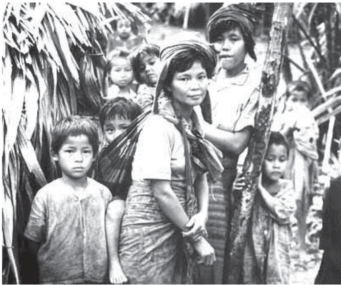
ဖိသံၣ်ဒီးပိၣ်မ့ၢ်လၢအတူၢ်ဘၣ်တၢ်မၤဆူၣ်သးလီၤသးကျဲးတဖၣ်