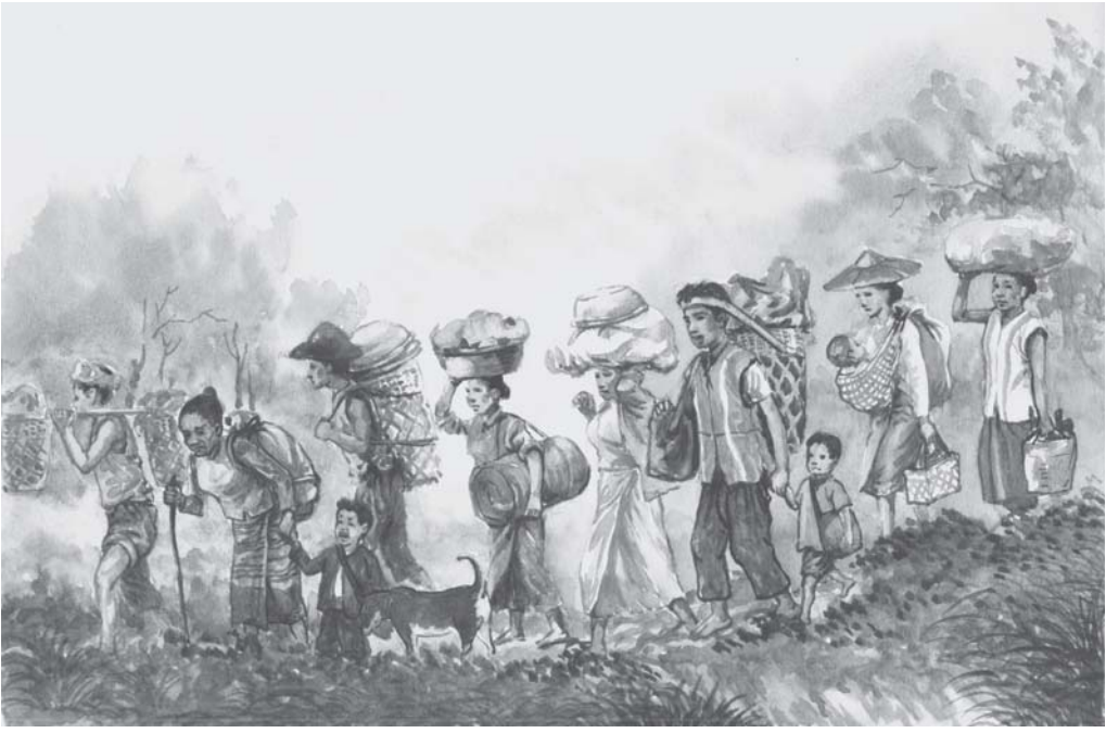
ထံၣ်ကီၢ်ဖိလၢအဘၣ်သ့ၣ်ဆုၣ်လီၢ်ကျဲၣ်တနီၤ

အယံၣ်ထံၣ်ဘၣ်ဖဲတၢ်ဟးဆုၣ်ကီၢ်အတၢ်ဖဲးတၢ်မၤ ဒီးပုၤမၤတၢ်ဖိတဖၣ်အဂ့ၢ်န့ၣ်ပုၤတၢ်ဘၣ်တၢ်ဖိတဖၣ်မၤဒီးန့ၢ် ဘၣ်အခွဲးအယၢ်လၢကဆၢတၢ်သကိးတၢ်န့ၣ်လီၤ.မ့ၣ်ဖဲတၢ် န့ၣ်လီၤမၤတၢ် (တၢ်သ့ၣ်လီၤသ့ၣ်ကျဲၣ်တဖၣ်) န့ၣ်ပုၤတဖၣ်န့ၢ် ဘၣ်အခွဲးအယၢ်စ့ၢ်ကိၣ်ဖိလၢကဟံၣ်ယုၣ်လၢတၢ်မၤတၢ်ဆၢတၢ် ဖိလၢစံၣ်အပုၤသ့ၣ်ခိဖျိကမျၢၢ်ပုၤတၢ်ကရၢကရိတဖၣ်ဒီးတၢ်မၤက စၢ်လၢအလိၣ်ဘၣ်ပုၤမၤတၢ်ဖိတဖၣ်န့ၣ်လီၤ.ဖဲတၢ်ဟံၣ်လီၤတၢ် စိၣ်ဆုၢ်ခူသ့ၣ်အဖိလၢစံၣ်အခါပုၤလၢဘၣ်တၢ်စိၣ်ဆုၢ်ခူသ့ၣ်အီၤ တဖၣ်တအိၣ်ဒီးအခါၣ်စးလၢကပၣ်ယုၣ်လၢတၢ်ဆၢတၢ်အကျိၤ အကွၢ်နီတမံၤဘၣ်လီၤ.