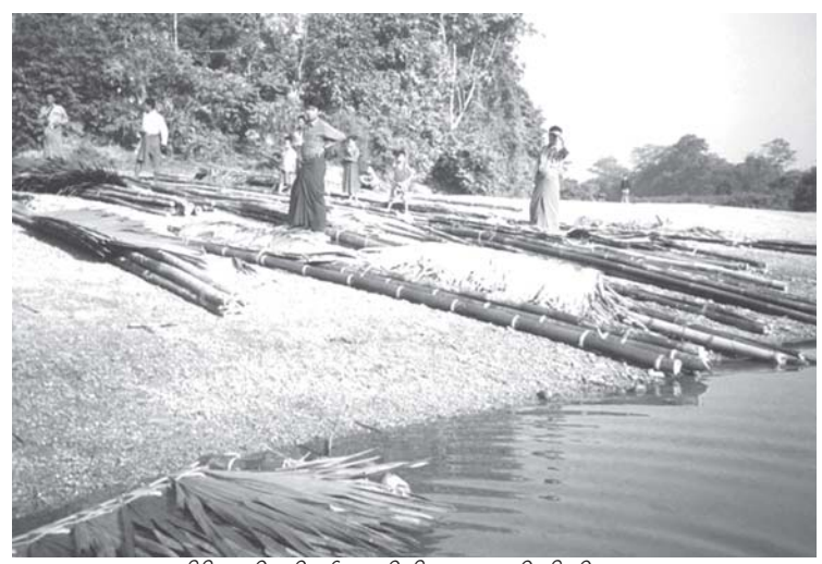
သပိတဖၣ်ဘၣ်တၢ်မၤဆူၣ်အီၤလၢကဘၣ်ကျိန့ၢ် သ့ၣ်. /ဝၣ်လၢပယီၤသးတဖၣ်အတၢ်သူၣ်ထီၣ်အဂီၢ်