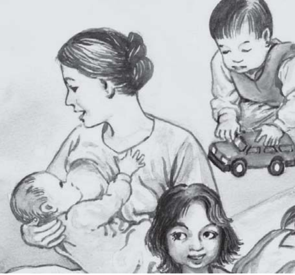
မိၢ်အိၣ်ဒီးတၢ်ခွဲးတၢ်ယၢ်လၢကဒုးအီၤအဖိနီၤထံ

၄) တၢ်ခွဲးတၢ်ယၢ်လၢကဟ့ၣ်ဒုးအီၤသ့ၣ်လၢအကစၢ် အနီၤထံ - (တၢ်ဂ့ၢ်အံၤတအိၣ်လၢတၢ်အၢၣ်လီၤအပူၤဘၣ် ဘၣ် ဆၢအိၣ်လၢတၢ်ဟ့ၣ်ကူၣ်ဟ့ၣ်ဖးအပူၤ - တၢ်ဂ့ၢ်တဖၣ်အံၤ ဘၣ် တၢ်ထၢန့ၣ်လီၤအီၤတယံာ်ဒ်ဘၣ်အယိအဖိကမိၢ်တအိၣ်ဒီး ဘၣ်)ပိၣ်မုၢ်လၢအမၤတၢ်တဖၣ်အိၣ်ဒီးတၢ်ခွဲးတၢ်ယၢ်လၢက ဟ့ၣ်ဒုးအိၣ်ဘၣ်အဖိလၢအကစၢ်အနီၤထံဖဲအမၤတၢ်အဆၢ ကတီၢ်န့ၣ်လီၤ. အါန့ၢ်အန့ၣ်တကယုအါထီၣ်အခွဲးလၢ ထံကီၢ် ပဒိၣ်တဖၣ်အအိၣ်လၢကဟ်လီၤတၢ်ဘျးသဲးစးဒ်သိးကဒိသ ဒါပုၤမိၢ်ဒါတဖၣ်လၢအဘၣ်မၤတၢ်လၢမုၢ်န့ၢ်အဆၢကတီၢ်န့ၣ် လီၤ.တၢ်ရဲၣ်တၢ်ကျဲၤအိၣ်စ့ၢ်ကိးလၢတၢ်ကယုထံကီၢ်တဖၣ်ဒ် သိးကဒိသဒါပုၤမိၢ်ဒါတဖၣ်ဒ်သိးအသုတမၤဘၣ်ဖဲးတၢ် မၤလၢ လီၤဘၣ်ယိၣ်မ့တမ့ၢ်ကဲထီၣ်တၢ်လီၤဘၣ်ယိၣ်သုလၢအတၢ်ဖဲး တၢ်မၤအပူၤဘၣ်န့ၣ်လီၤ.