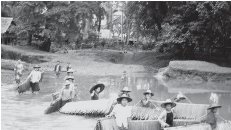
သဝီဖိတဖၣ်ဘၣ်လဲၤစီၢ်ဆူၣ်ပယီၤသးအလၢလၢအဝဲသ့ၣ်တၢ်သ့ၣ်ထီၣ်အဂီၢ်

တၢ်သံကွၢ်စံးဆၢဒီးသဝီခိၣ်လၢက ညီကီၢ်စံၣ် ၂၀၀၃