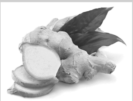
ချင်းပုံ