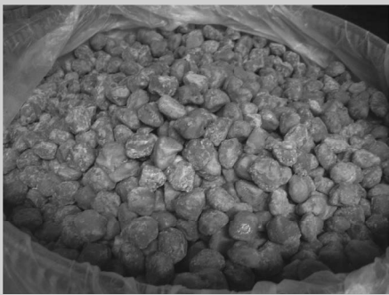
ထန်းလျက်ပုံ