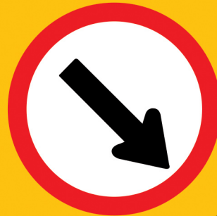
ညာဘက်ကပ်ပါ