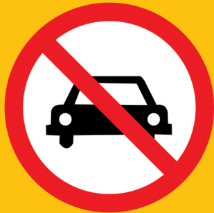
ကား မဝင်ရ