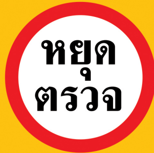
စစ်ဆေးရန် ရပ်ပါ