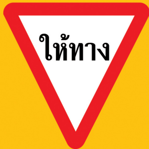
အတက်ယာဉ်ကို ဦးစားပေးပါ