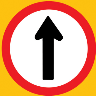
ဆက်မောင်းပါ