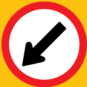
ဘယ်ဘက်ကပ်ပါ