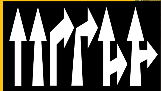
ပုံစံပြ မြားဦးများ